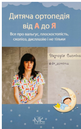
Дитяча ортопедія від А до Я