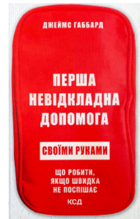
Перша невідкладна допомога своїми руками. Що робити якщо швидка не поспішає