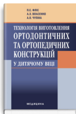
Технологія виготовлення ортодонтичних та ортопедичних конструкцій у дитячому віці: підручник (ВНЗ I—III р. а.)