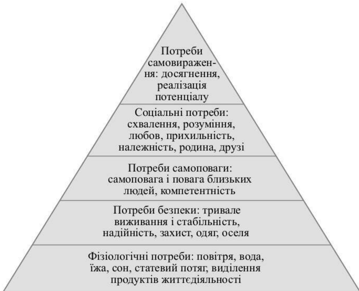
СХЕМА 4. Класифікація потреб людини за А. Маслоу

За А. Маслоу, ядро особистості утворюють гуманістичні потреби в добрі, моральності, доброзичливості, з якими людина народжується і які вона може реалізувати за певних умов. Однак ці потреби у самовираженні задовольняються лише за умов задоволення інших потреб і передусім фізіологічних (потреб у їжі, воді, повітрі, сні тощо). Наприклад, особа, яка голодує, мусить спочатку задовольнити свою потребу в їжі, а вже потім турбуватися про свою зовнішність чи житло.