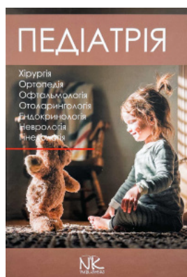
Педіатрія. Том 3