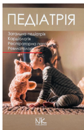
Педіатрія. Том 1