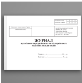
Журнал щозмінного передрейсового та післярейсового медичних оглядів водіїв, форма 137-2/0