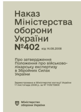
Наказ МОУ № 402 — Положення про військово-лікарську експертизу в ЗСУ (+ 262 наказ від 27.04.24 про зміни)