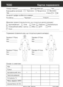
Медична картка пораненого ТССС А5