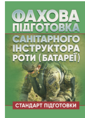
Фахова підготовка санітарного інструктора роти (батареї). Стандарт підготовки