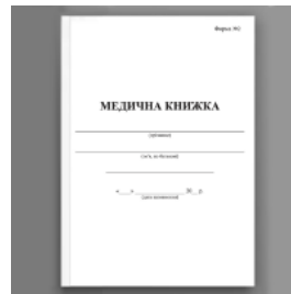
Медична книжка, форма 2