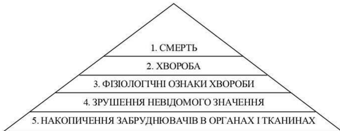
Рис. 1.3. Рівні біологічної відповіді організму людини на вплив шкідливих та небезпечних факторів навколишнього середовища

ді організму людини на вплив шкідливих та небезпечних факторів навколишнього середовища (рис. 1.3).