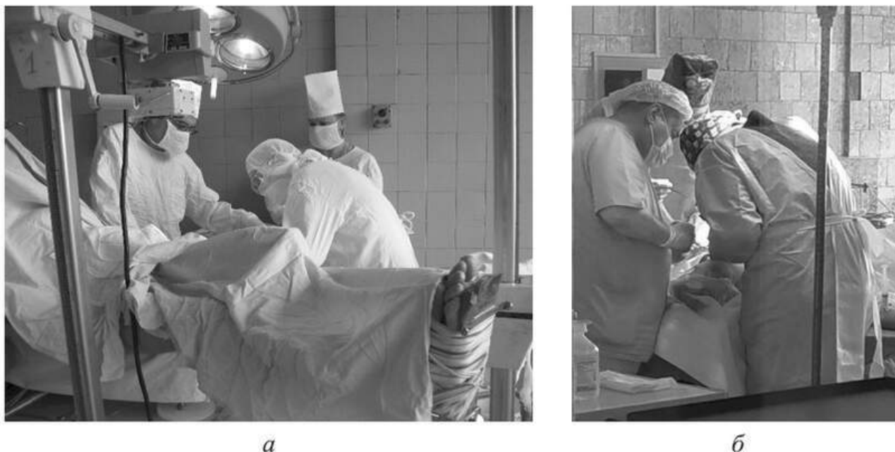
Рис. 1.2. Вимушене положення тіла (з нахилом корпусу на кут більше 30^\circ ) лікарів-хірургів під час оперативного втручання

Для працівників багатьох медичних спеціальностей характерним є обмеження рухової активності протягом робочого дня. І ця ситуація погіршується тим, що медичне устаткування, яке використовується в даний час в медичних установах, не завжди відповідає основним ергономічним вимогам за параметрами і конструктивними особливостями (наприклад, стільці з жорсткою фіксацією, відсутність підлокітників тощо).