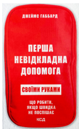
Перша невідкладна допомога своїми руками. Що робити якщо швидка не поспішає