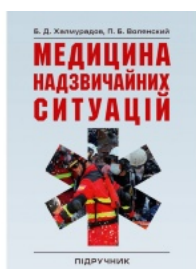
Медицина надзвичайних ситуацій