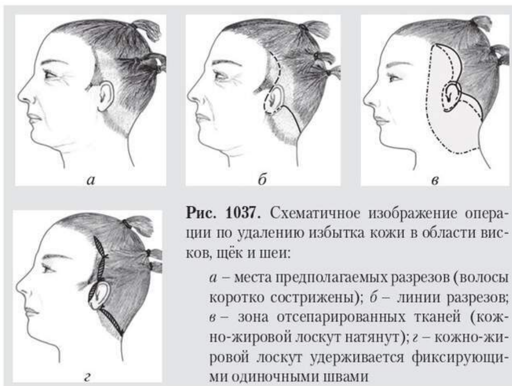
Рис. 1037. Схематичное изображение операции по удалению избытка кожи в области висков, щёк и шеи:

Операцию выполняют последовательно на каждой стороне лица. Разрез кожи начинают в височной области и опускают его до верхнего края ушной раковины, а затем, плавно огибая ушную раковину (впереди козелка и вокруг уха), продолжают по заушной складке до сосцевидного отростка с поворотом на шею. Отслаивают кожно-жировой лоскут. В верхних отделах лица отслойку лоскута следует проводить более щадяще, чем в нижних (на шее кожу можно отслаивать до средней линии). Делают гемостаз. Кожу натягивают (мобилизуют) вверх и кзади так, чтобы на лице и шее все складки расправились. Избытки кожи иссекают. Кожно-жировой лоскут удерживают в заданном положении фиксирующими одиночными швами. Послеоперационную рану ушивают непрерывными или одиночными швами из нерассасывающихся нитей. Накладывают циркулярную бинтовую давящую повязку на 3–4 дня. Швы снимают на