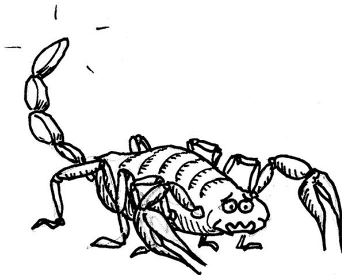
НЕЩАСНИЙ СКОРПІОН БЕЗ АНУСУ

Їжа погано назбирується в череві скорпіона. Минає близько восьми місяців від моменту, коли він втрачає свій хвіст, і до того, коли він помирає. Багато їжі йому теж не вдається добути, бо ж саме хвіст — його смертельна зброя проти здобичі. Суть його життя протягом цих восьми місяців досить проста. Скорпіон усе ще здатен «завалювати», або скажемо культурніше: скорпіон може розмножуватися. (Скорпіони не вдаються до запобіжних засобів, а якби й використовували презервативи, то робили б у них дірки.)