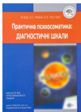
Практична психосоматика: діагностичні шкали